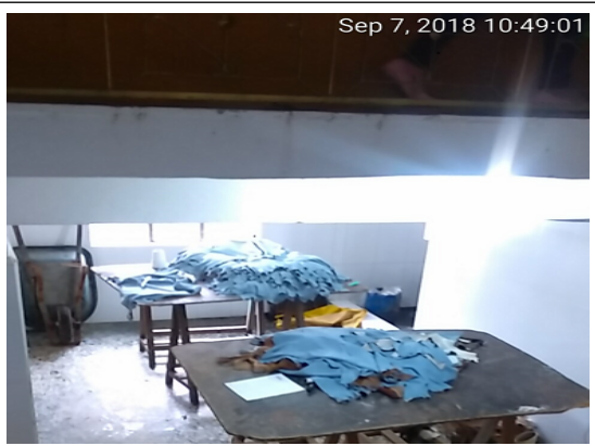
Foto No. 2 Proceso de curtido de pieles