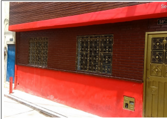
Foto No. 1 Fachada del establecimiento