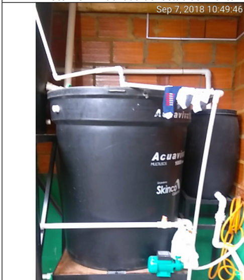
Foto No. 3 Sistema de tratamiento de aguas residuales producto del proceso