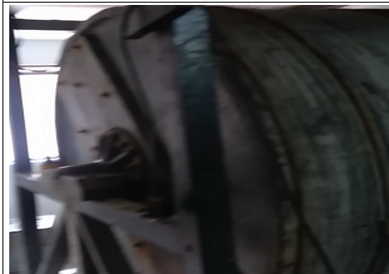
Foto No. 5 bombo 1 de procesamiento húmedo